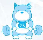
ウェイトリフティング