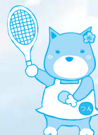
【デモスポ】バウンドテニス